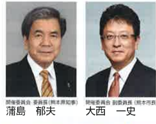
熊本県知事 浦島 郁夫 副知事 大西 一史

2022年 11/9 水 10:00-17:00 10 木 10:00-16:00 会場 グランメッセ熊本 熊本県上益城郡益城町福富1010 益城熊本空港に隣接